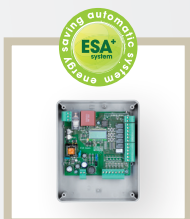
ESA BASIC 9176108

Systém pro snížení spotřeby energie. V modelu JM.3 použití ESA BASIC není kompatibilní s provozem na baterie.